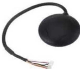
Рис. № 8 - Модуль GPS-навигации.

Рассмотрим радиопередающие системы, установленные на БПЛА.