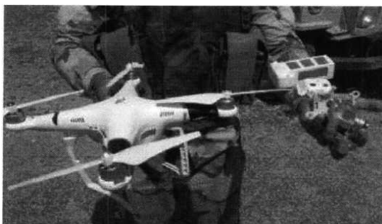
Рис. № 1 - БВС вертолетного типа.

Для совершения диверсионных актов могут использоваться БВС самолетного и вертолетного типа (рис. № 1) кустарного производства, причем доля последних значительно превышает количество самолетных. Объясняется это в первую очередь их более низкой стоимостью.