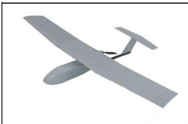
Рис. № 6 – БПЛА самолетного типа.

Существуют БПЛА, предназначенные для выполнения задач РЭР, РЭБ и связи. Скоростной диапазон работы - от 15 до 30 м/с. Рабочие высоты - в зависимости от оборудования и размеров аппарата, но всегда превышают 300 м. Обычно это диапазон высот 300 - 2000 м. Существует несколько аэродинамических схем самолетных БПЛА. Основные аэродинамические схемы – классическая (рис. № 6) и «летающее крыло» (рис. № 7).