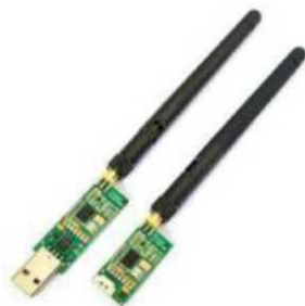
Рис. № 9 - Модем телеметрии.

Модем телеметрии (рис. № 9) - приемное устройство, предназначенное для обмена информацией между наземной станцией и БПЛА. От наземной станции он посылает команды к выполнению, от БПЛА - принимает на наземную станцию информацию, получаемую с датчиков (например, скорость, потребление тока, напряжение, положение в пространстве. Обычно является основным каналом управления БПЛА.