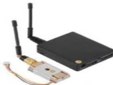
Рис. № 10 - Видеопередатчик.

Видеопередатчик (рис. № 10) - это устройство, передающее на наземную станцию изображение с камер БПЛА. Является самым заметным устройством на борту БПЛА, поэтому без необходимости включать его не стоит (это касается только тех БПЛА, которые хранят фотографии на борту), соблюдая режим радиомолчания. Такой режим уменьшает возможность применения противником средств РЭБ.