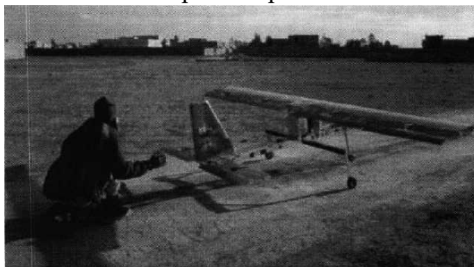
Рис. № 4 - малогабаритный летательный аппарат.

БВС-камикадзе является весьма специфичным классом беспилотной техники, информация о котором чаще всего носит секретный характер. Такой дрон представляет собой малогабаритный летательный аппарат (рис. № 4), способный нести несколько килограмм взрывчатки.