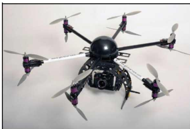
Рис. № 5 - многооторный БПЛА.

Тип БПЛА, который с каждым днем получают все большее распространение, - многооторные системы. Их еще называют мультикоптерами, квадрокоптерами, гексакоптерами, октакоптерами и тому подобное, в зависимости от количества несущих винтов. Характерная особенность - многооторная система, принцип полета - подобен вертолетному (рис. № 5).