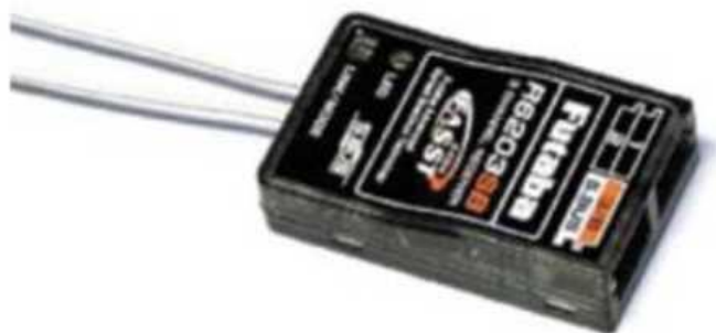
Рис. № 11 - Приемник аппаратуры управления.

Видеопередатчик (рис. № 10) - это устройство, передающее на наземную станцию изображение с камер БПЛА. Является самым заметным устройством на борту БПЛА, поэтому без необходимости включать его не стоит (это касается только тех БПЛА, которые хранят фотографии на борту), соблюдая режим радиомолчания. Такой режим уменьшает возможность применения противником средств РЭБ.