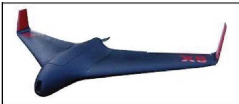
Рис. № 7 – БПЛА тип «летающее крыло».